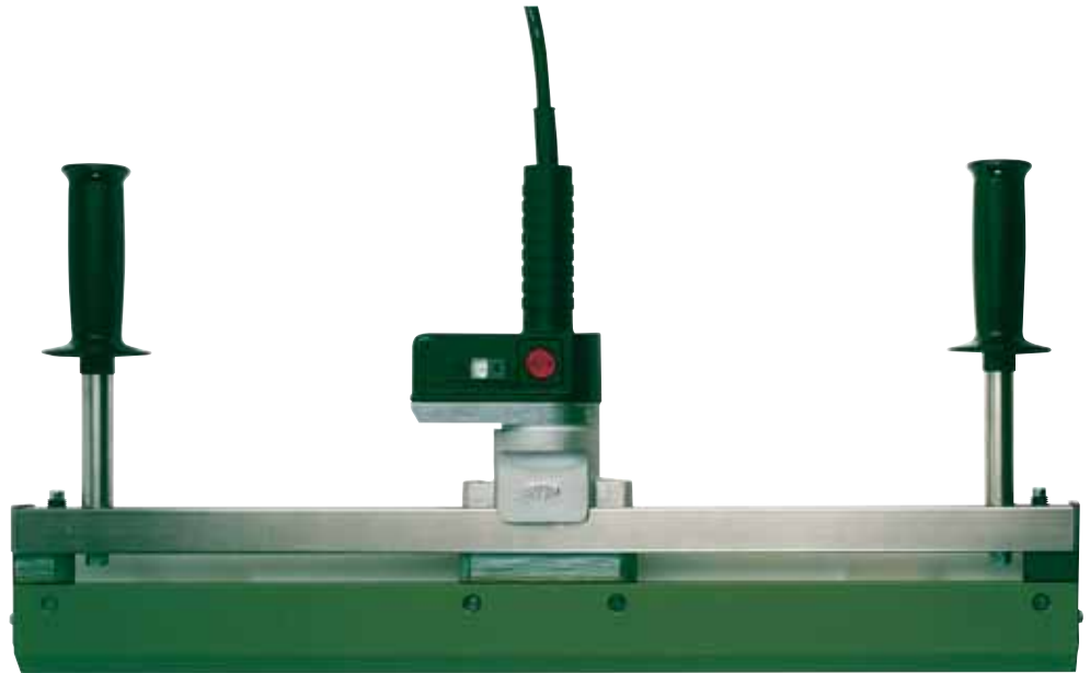
WIDOS Heizschwert WIDOS heating blade WIDOS lame chauffante