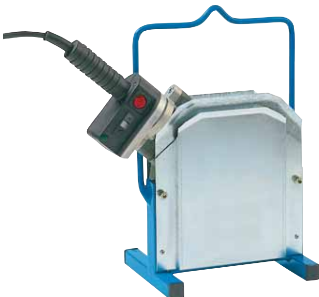
WIDOS Einstellkasten zum geschützten Abstellen des Heizelementes WIDOS heat-protected box for the safe storage of the hand-held heating tool WIDOS boîtier support pour le stockage protégé du miroir à main