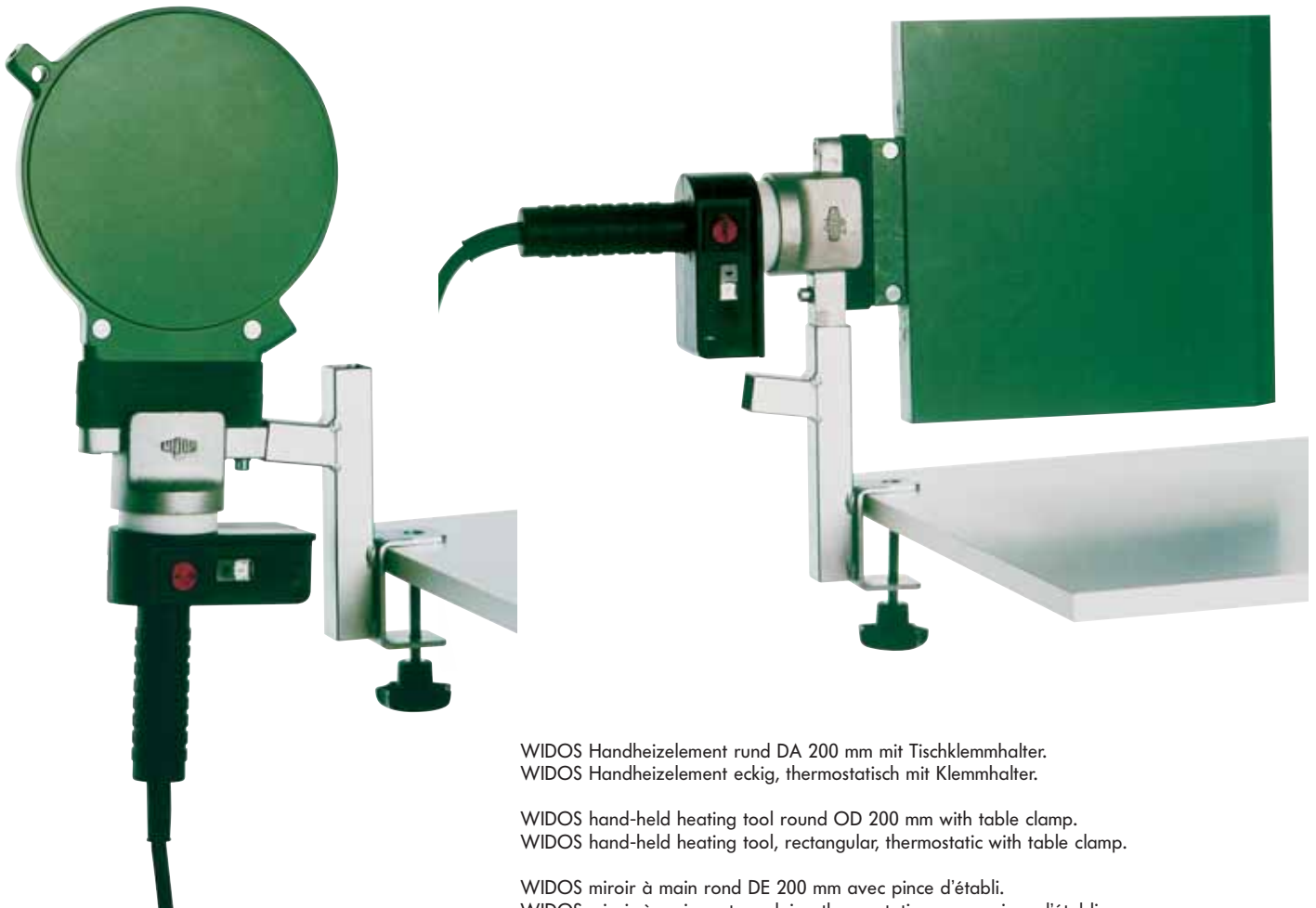
WIDOS Handheizelement rund DA 200 mm mit Tischklemmhalter. WIDOS Handheizelement eckig, thermostatisch mit Klemmhalter.

Sous réserve de modifications techniques.