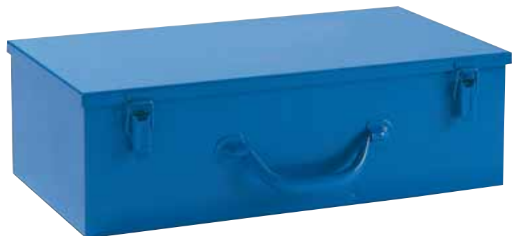
WIDOS Stahlblechtragekasten für WIDOS Handheizelemente WIDOS steel carrying case for WIDOS hand-held heating tools WIDOS coffret métallique pour WIDOS miroirs à main